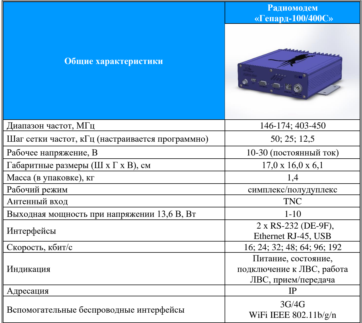
Таблица 2. Предварительные технические характеристики радиомодема «Гепард-100/400С».

Радиомодем предназначен для обслуживания современных АСУ ТП, использующих оборудование с интерфейсом Ethernet по протоколу TCP/IP в эфире. Такой радиомодем представляет собой более современное устройство, обладающее расширенными функциональными возможностями.