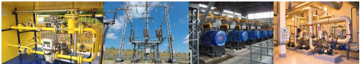
Объекты, оснащаемые АСУ ТП ЖКХ

С начала их создания работа значительной части автоматизированных систем управления технологическими процессами (АСУ ТП) в жилищно-коммунальном хозяйстве (ЖКХ) 3 обеспечивалась узкополосными технологическими радиосетями обмена данными (ТРОД) 4 .