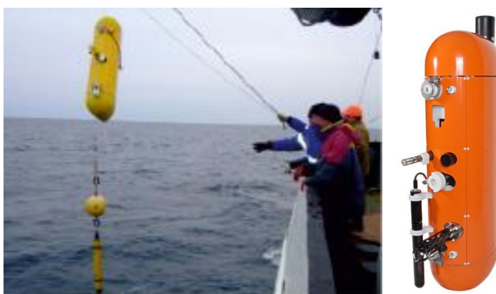
Испытания системы «Аквалог» на Черном море.

«Аквалог» представляет собой устройство, которое автоматически совершает проходы вверх и вниз по тросу, натянутому между донным якорем и притопленной плавучестью. В процессе движения и профилирования водной толщи «Аквалог» ведет измерения, собирает данные, а также передает информацию на береговую станцию. Трансляция данных ведется в следующем порядке: индуктивный модем SBE – несущий трос – притопленная плавучесть – кабель-трос – поверхностный буй – узкополосный радиомодем УКВ диапазона – судно или береговая станция. В первом образце системы, испытания которого были проведены в акватории Черного моря, применялся «прозрачный» радиомодем, обеспечивавший обмен данными на скоростях 4,8-19,2 кбит/с в диапазоне ультра высоких частот (УВЧ).