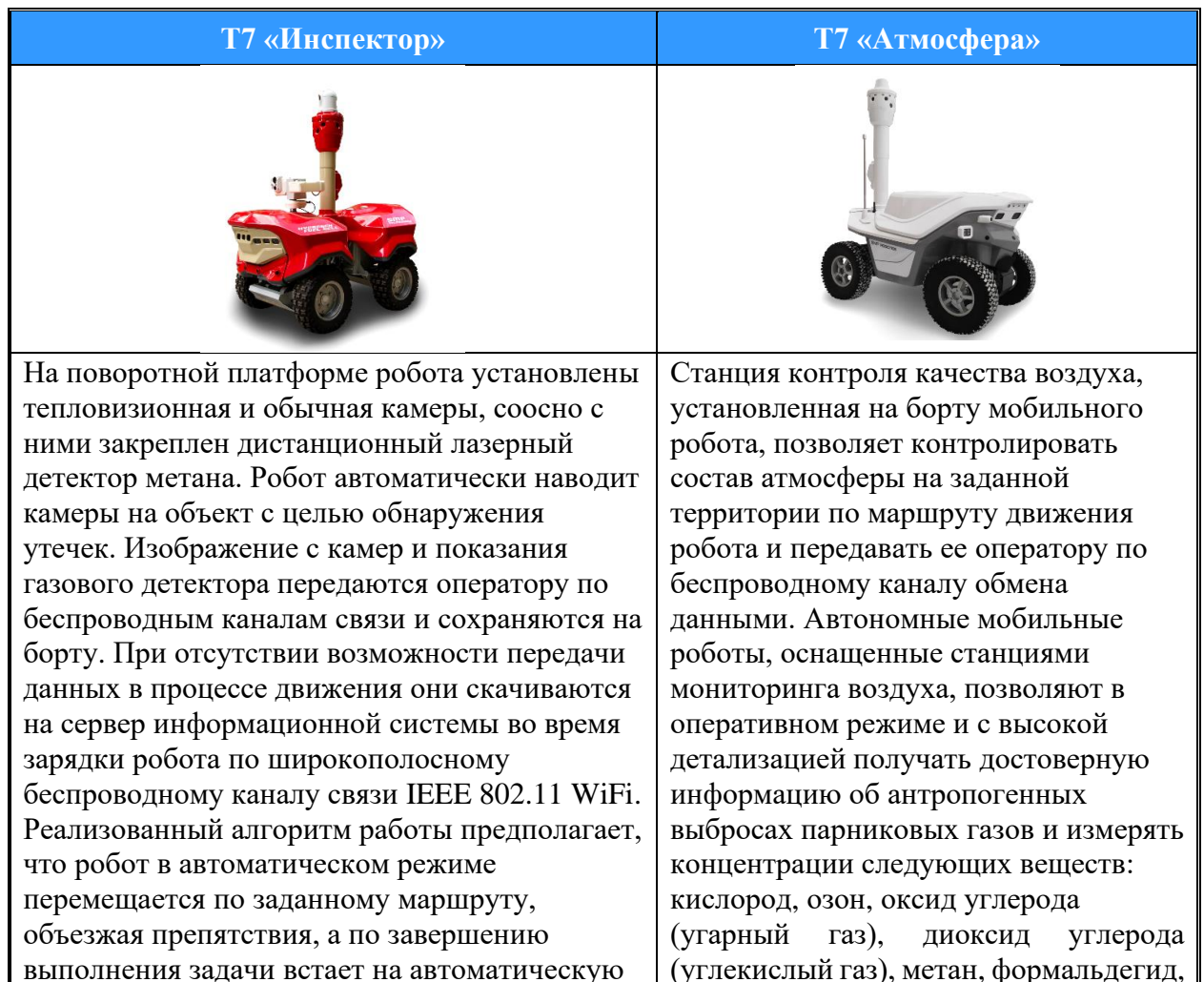
Таблица 1. Перечень и назначение автономных подвижных наземных роботов платформы Т7 ООО «СМП Роботикс».

Краткая информация о роботах, входящих в состав вышеуказанной платформы, представлена в Таблице 1.