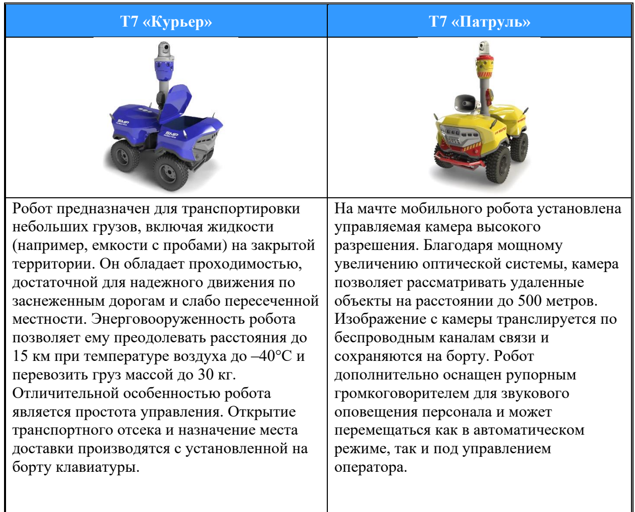
Таблица 1. Перечень и назначение автономных подвижных наземных роботов платформы Т7. (продолжение)