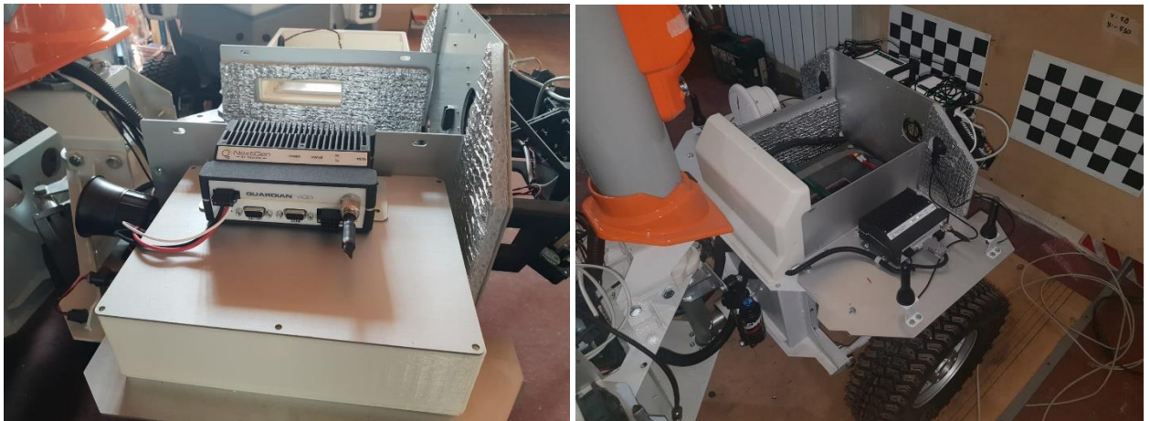
Рис. 2. Радиомодем Guardian-400 на борту робота T7 «Инспектор» в ходе лабораторного этапа испытаний.

Основные технические характеристики радиомодема Guardian представлены в Таблице 2.