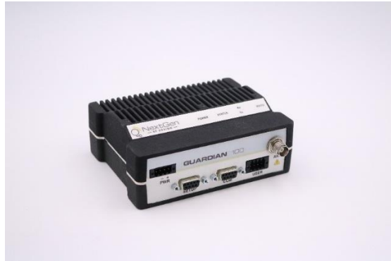
Рис. 1. Общий вид радиомодема Guardian.

отметить, что данное устройство представляет собой «прозрачное» 2 устройство, работающее по последовательному интерфейсу, не позволяющее производить удаленную настройку радиосети, в связи с чем все настройки были выполнены заранее. Удаленная настройка полезной нагрузки программой испытаний не предусматривалась и на практике не производилась. Общий вид радиомодема Guardian представлен на Рис. 1 и 2.