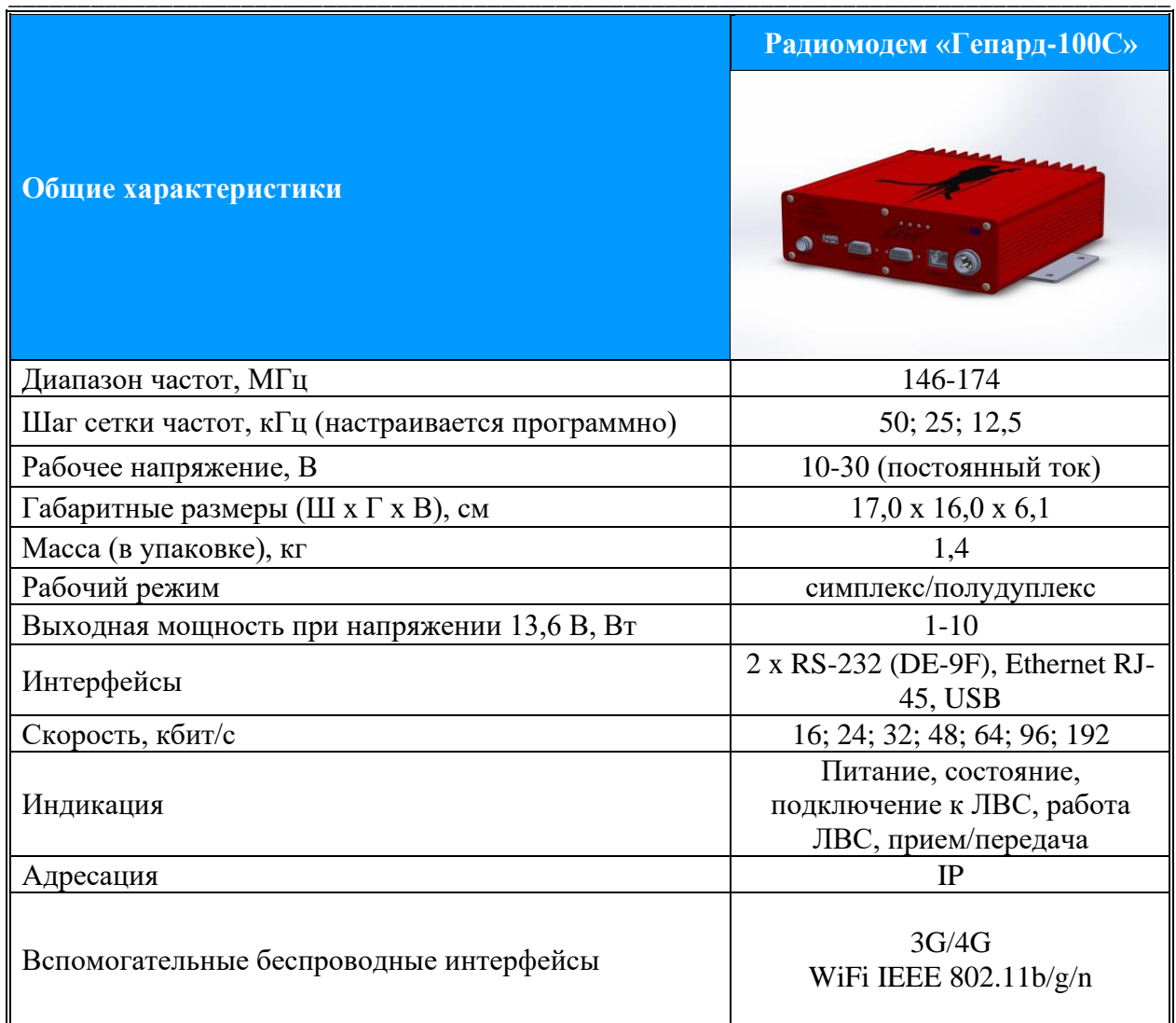
Таблица 2. Основные технические характеристики радиотехнического оборудования для подсети СВЧ диапазона.