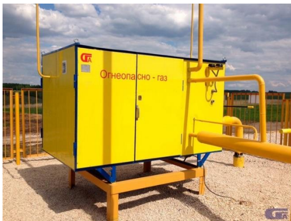
Газорегуляторный пункт ( www.gazapparat.ru ).

– газорегуляторные установки для питания газовых сетей или целиком объектов с расходом газа до 1,5 тыс. м 3 в час.