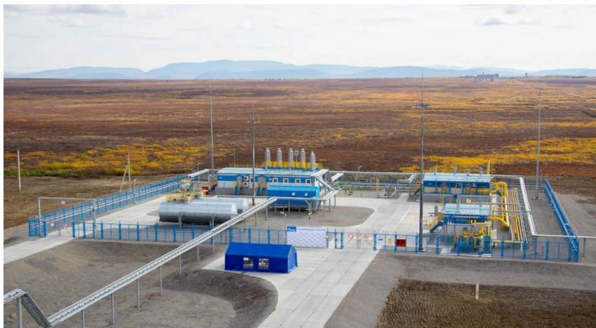
Газораспределительная станция ( www.ngosar.ru/gazovoe-oborudovanie/agrs.html ).

Ранее ПАО «Газпром» отвечало за строительство магистральной инфраструктуры, газораспределительных станций (ГРС 1 ), межпоселковых газопроводов, газопроводов-отводов до границы населенного пункта. С началом реализации программы у организации появилась новая задача – строительство распределительных газопроводов до границ земельных участков. Решение этой масштабной задачи повлечет за собой необходимость совершенствования и дальнейшего развития ранее созданной инфраструктуры газораспределительной системы в связи с увеличением объемов перекачиваемого газа и строительством более разветвленной сети.