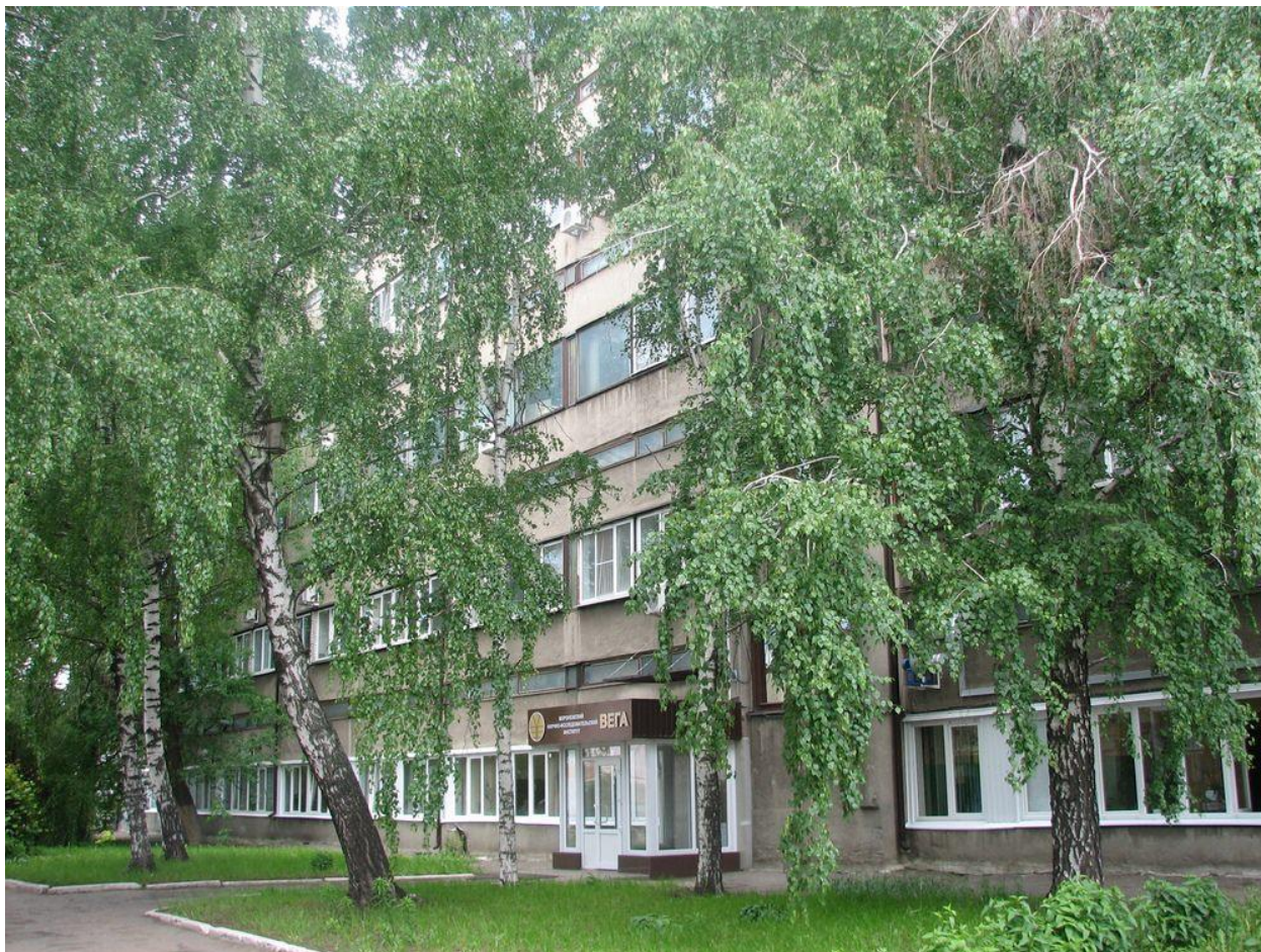
Основной корпус АО «ВНИИ «Вега»

В начале февраля 2023 года было подписано соглашение о сотрудничестве между АО «ВНИИ «Вега» (входит в Концерн «Автоматика холдинга «Росэлектроника», www.vniivega.ru ) и ООО «НЦПР» ( www.flexlab.ru ) о совместной разработке интегрированных технических решений для обмена данными в высокоскоростных широкополосных и высоконадежных узкополосных радиосетях 1 .