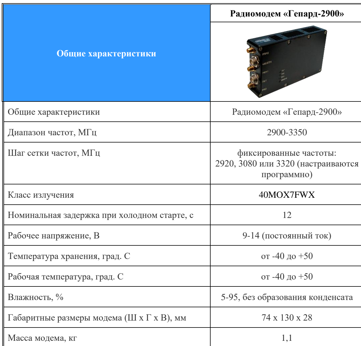
Таблица 3. Технические характеристики радиомодема «Гепард-2900».