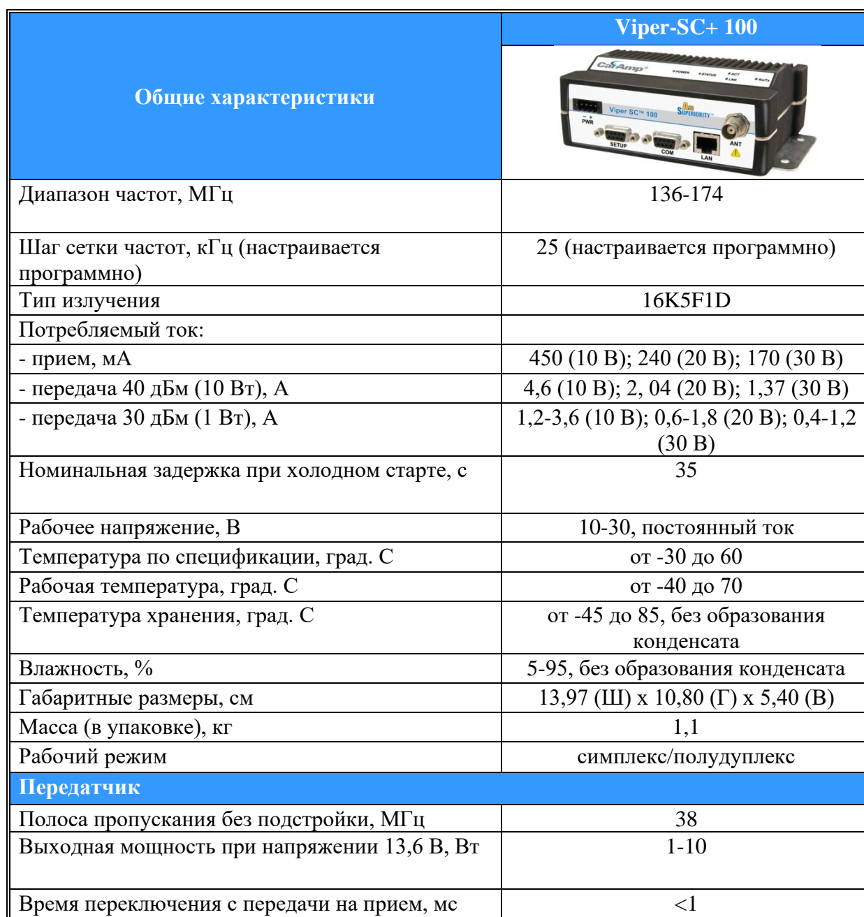
Таблица 2. Технические характеристики радиомодема Viper-SC+ 100.