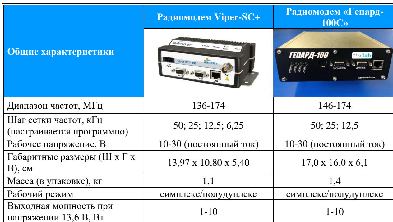
Таблица 2. Сравнительные технические характеристики радиомодемов Viper-SC+ 100 и «Гепард-100С».

Во многом он сопоставим с имеющимися на российском рынке радиомодемами зарубежного производства, поэтому его технические характеристики представлены в сравнении с техническими характеристиками наиболее популярного из них, американского радиомодема Viper-SC+ 100 150-5018-502.