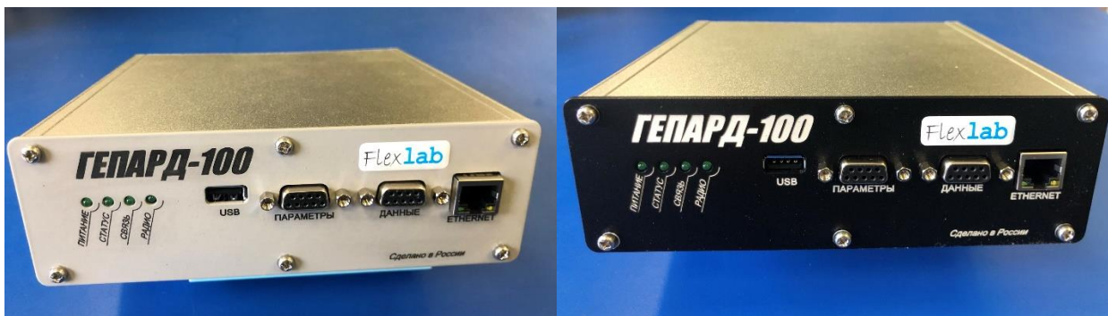
Фото 1. Узкополосный радиомодем «Гепард-100».

В рамках этапа проведены испытания радиомодема и подтверждены ранее заявленные характеристики. Кроме того, реализована часть предложений, внесенных вами, наши уважаемые подписчики. В частности, все интерфейсные разъемы изделия вынесены на переднюю панель.