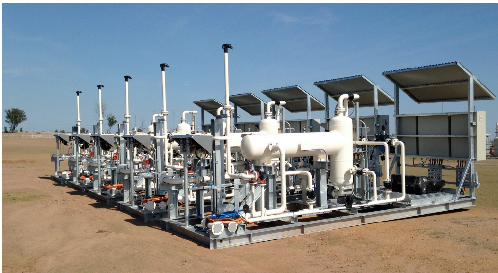
Кустовая площадка компании Westside Corporation Pty Ltd., с оборудованием системы электропитания на солнечных батареях.

Первоначально сбор данных с устьев газовых скважин в компании Westside производился в ручном режиме. Техники компании периодически объезжали работающие скважины и снимали показания приборов расхода, давления и уровня. После этого полученная информация загружалась в базу данных, в которой производилась их синхронизация с целью дальнейшего использования. Поскольку ручной сбор данных производился в различное время и с различной периодичностью, получить объективную оценку текущего технологического процесса не представлялось возможным.