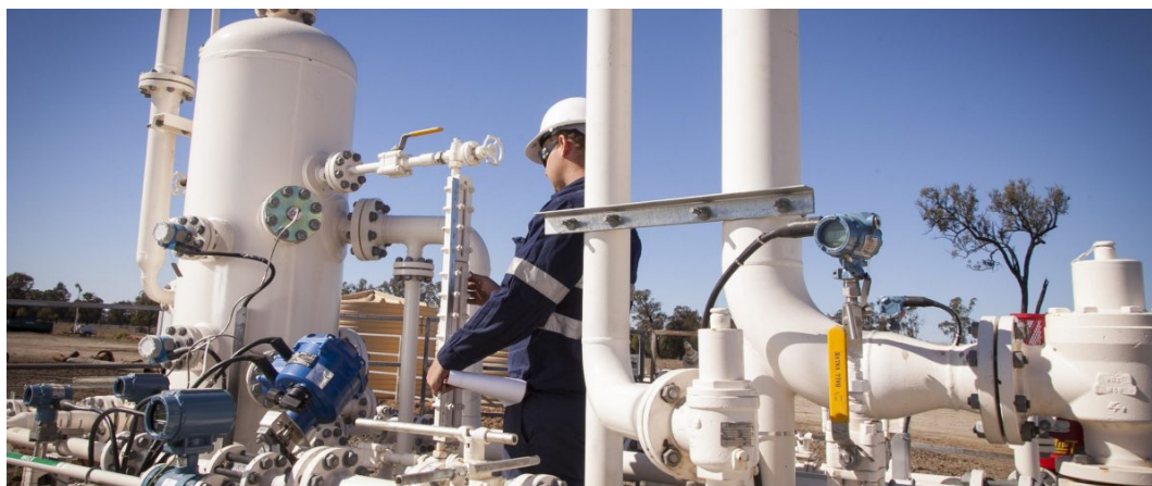
Объект компании Westside Corporation Pty Ltd.

опроса. Кроме того, с каждым сообщением от удаленного объекта направляется информация о техническом состоянии радиомодемов.