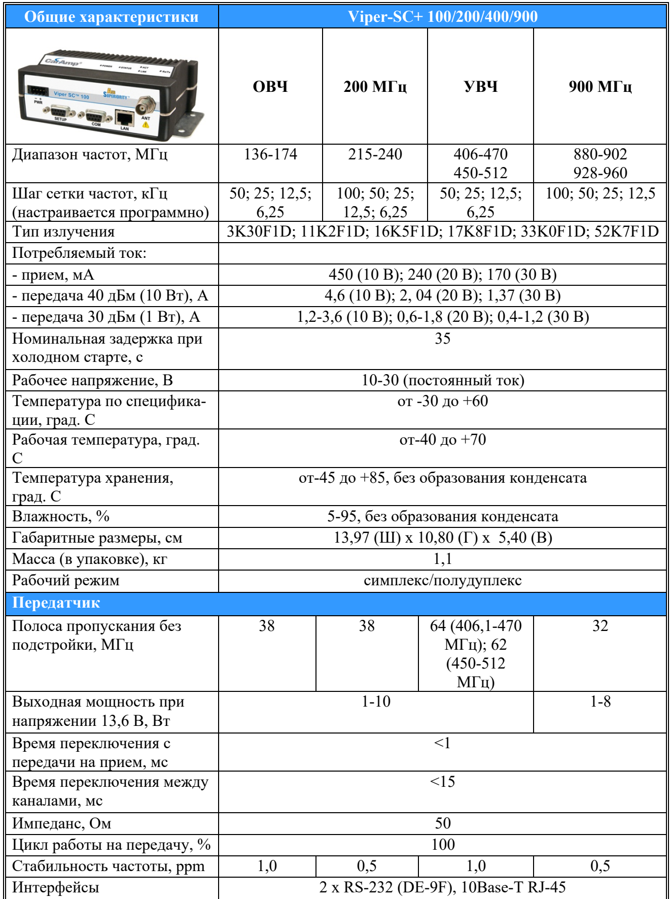
Таблица 2 Технические характеристики радиомодема Viper-SC+