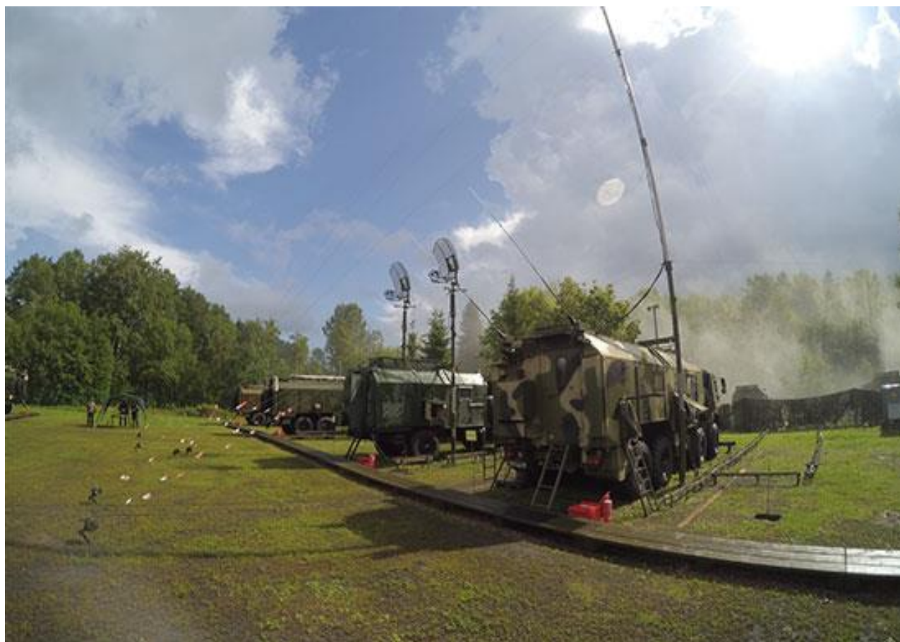
Подразделение войск связи в полевых условиях

Использование в интересах вооруженных сил (ВС) серийно выпускаемого радиоэлектронного оборудования, первоначально создававшегося для гражданских нужд, получило достаточно широкое распространение. В США этот принцип комплектования, получивший название COTS (Commercial off-the-shelf), применяется с начала 80-х годов прошлого столетия. Он предполагает принятие на вооружение и снабжение ВС гражданской продукции различного назначения после ее предварительной адаптации к действующим требованиям.