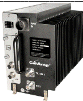
Рис. 1. Внешний вид бортового радиомодема ITC 220.

Основные технические характеристики бортового радиомодема ITC 220 представлены в Таблице 2.