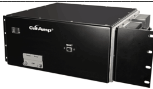
Рис. 3. Внешний вид радиомодема базовой станции ИТС 220.

Основные технические характеристики радиомодема базовой станции ИТС 220 представлены в Таблице 4.