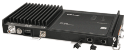
Рис. 2. Внешний вид стационарного радиомодема ИТС 220.

Внешний вид стационарного радиомодема ИТС 220 представлен на рис. 2.