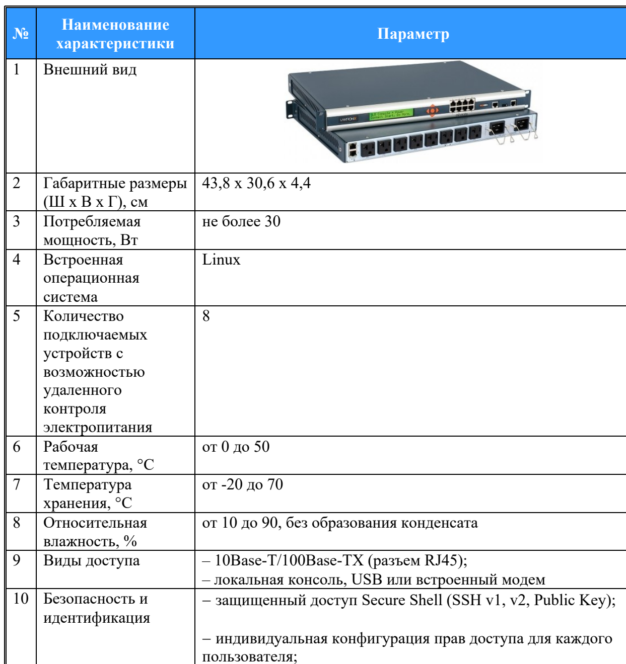
Таблица 1. Технические характеристики консольного сервера Lantronix SLB.

Технические характеристики консольного сервера Lantronix SLB представлены в Таблице 1.